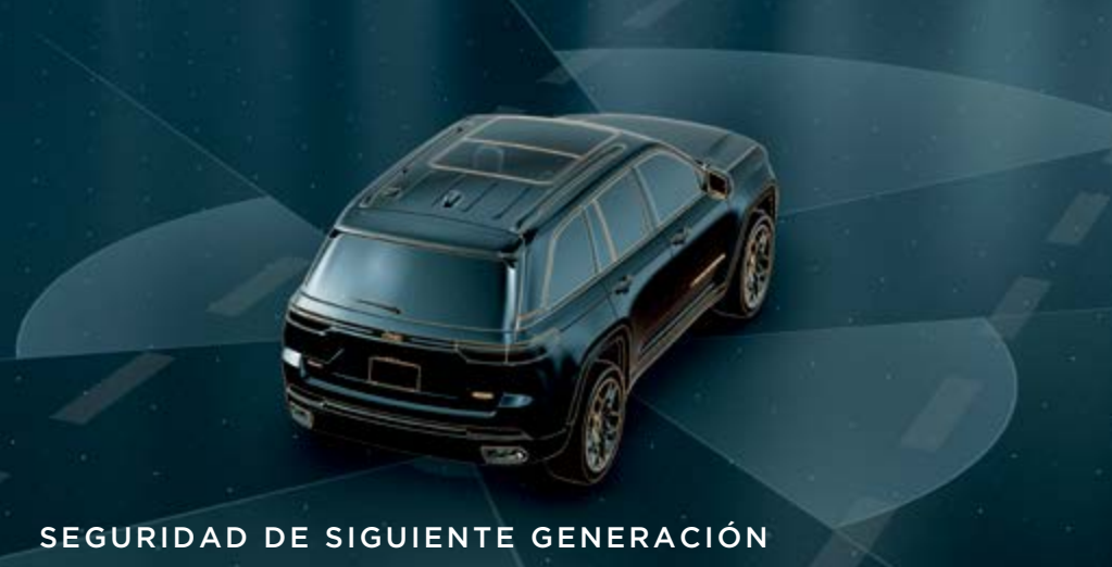
SEGURIDAD DE SIGUIENTE GENERACIÓN