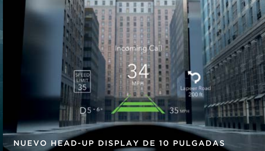
NUEVO HEAD-UP DISPLAY DE 10 PULGADAS