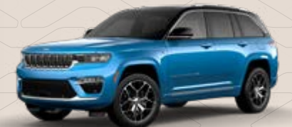
Hydro Blue * Overland y Summit Reserve