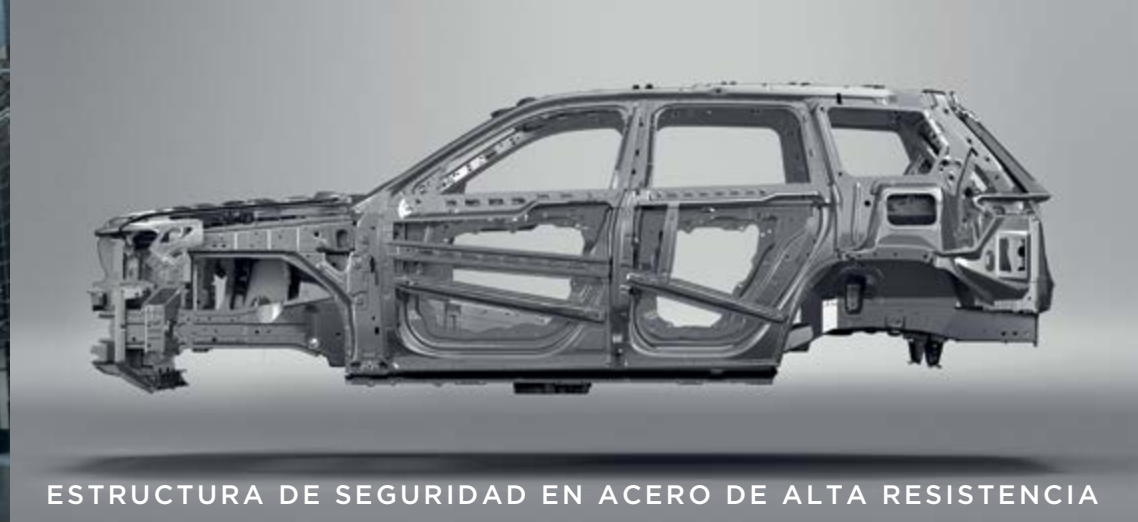
ESTRUCTURA DE SEGURIDAD EN ACERO DE ALTA RESISTENCIA